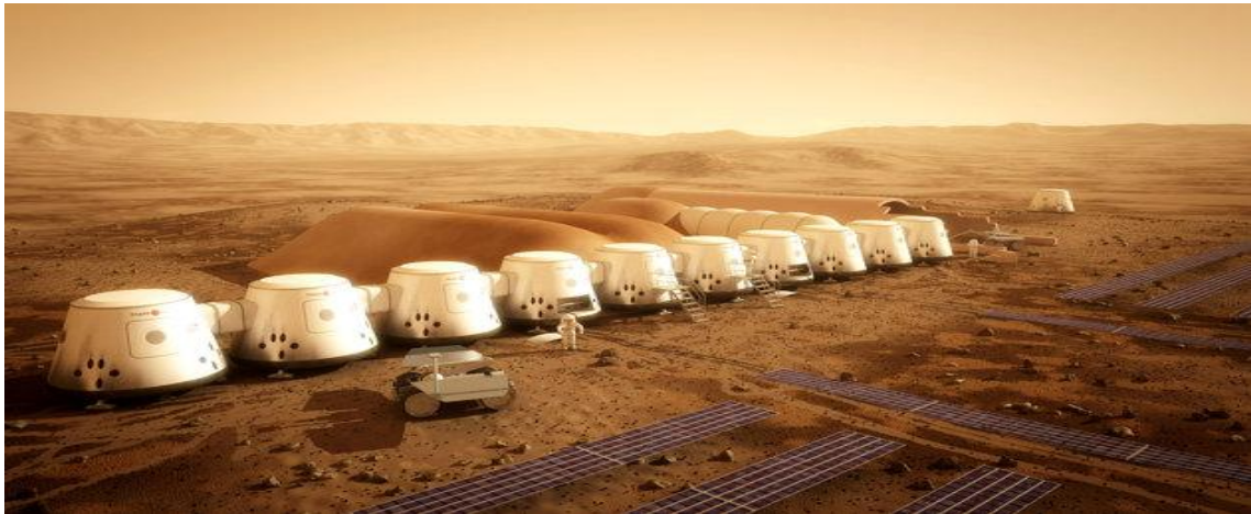
Imagem da estação que a Mars One planeja construir.

sempre! Quem já viveu sem voltar? Ou quem irá para MARTE sem querer voltar? Penso que todos os inscritos não pensaram de fato o que significa NÃO VOLTAR? Ou viver nestes casulos, com este tipo de abastecimento da foto seguinte.