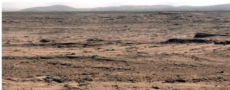
Imagem de Marte feita pela sonda "Curiosity".

CRIAR meios para viver como propõe Mars One em MARTE, TEM SE TORNADO UMA PERGUNTA DIFÍCIL DE RESPONDER OU PENSAR, ou talvez não, porque quem conseguiu viver todos os dias no deserto da forma que ele é? Na TERRA.