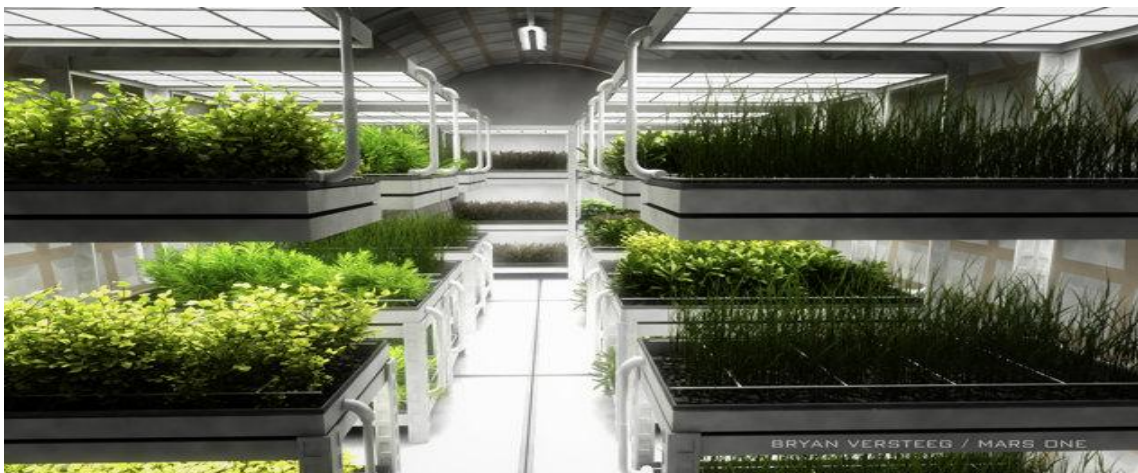
Imagem de uma das plantações que a Mars-One levaria a Marte.

Hoje a humanidade tendo tudo o que tem no planeta TERRA, cai em depressão, por qualquer motivo, se irá por qualquer coisa com seu semelhante, tem pressa para tudo que esta a seu redor, a tecnologia os ira facilmente, a qualquer custo querem burlar as informações ou manipulá-las! E o mais interessante é que a humanidade se cansa rápido de tudo.